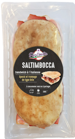
Saltimbocca speck et brie

Poids UVC Kg : 0,200 GENCOD : 3760269071186 DLC garantie en jours : 12 PCB : 6 Code article : AP014