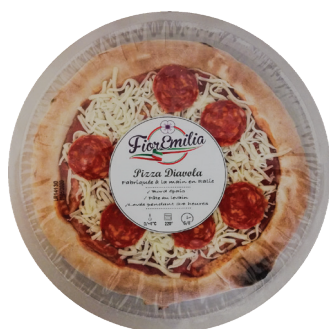
Pizza diavola (salame)

Poids UVC Kg : 0,400 GENCOD : 3760269071032 DLC garantie en jours : 12 PCB : 8 Code article : ADP003