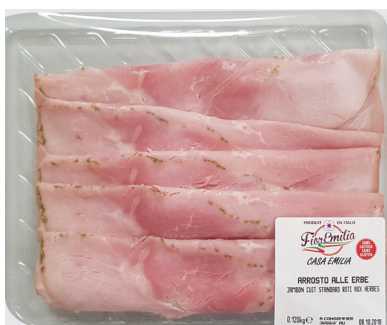
Jambon aux herbes

Poids UVC Kg : 0,120 GENCOD : 3275764000086 DLC garantie en jours : 12 PCB : 5 Code article : PROCOERA120