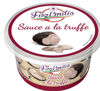
Sauce à la Truffe

Poids UVC Kg : 0,150 GENCOD : 3760269071070 DLC garantie en jours : 30 PCB : 6 Code article : FB004