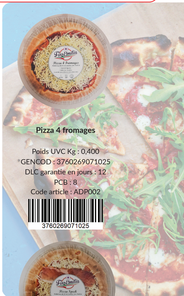
Pizza 4 fromages

Poids UVC Kg : 0,400 GENCOD : 3760269071025 DLC garantie en jours : 12 PCB : 8 Code article : ADP002