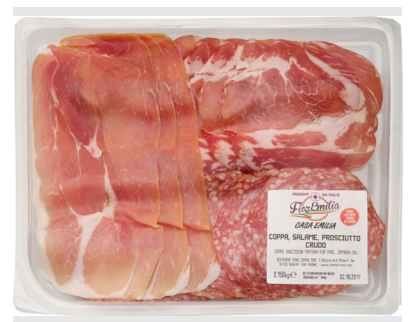
Plateau assortiment (coppa, jambon cru, saucisson)

Poids UVC Kg : 0,150 GENCOD : 3275764000109 DLC garantie en jours : 12 PCB : 5 Code article : ANTCPAF150