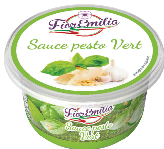
Sauce pesto Vert

50 années de recherche et développement nous ont permis d'améliorer nos recettes et d'atteindre des niveaux de qualité très élevés, identiques à des sauces «faites maison». Notre Pesto, fabriqué à froid, conserve toutes ses caractéristiques organoleptiques, son parfum et le goût des ingrédients.