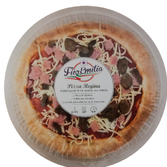
Pizza regina (champignons)

Nous travaillons la pâte avec une méthode unique, brevetée, qui ne dénature pas la pâte. Les tomates et la mozzarella sont 100% italiennes, le jambon de qualité supérieure, les légumes soigneusement sélectionnés ne sont que quelques exemples du soin que nous prenons dans la sélection de nos ingrédients.