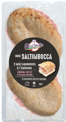
Mini saltimbocca jambon cuit mozzarella

Poids UVC Kg : 0,200 GENCOD : 3760269071155 DLC garantie en jours : 12 PCB : 6 Code article : AP011