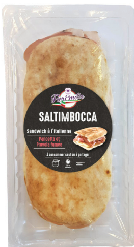
Saltimbocca pancetta provola affumicata

Poids UVC Kg : 0,200 GENCOD : 3760269071193 DLC garantie en jours : 12 PCB : 6 Code article : AP015