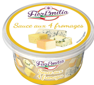
Sauce aux 4 fromages

Poids UVC Kg : 0,200 GENCOD : 3760269071063 DLC garantie en jours : 30 PCB : 6 Code article : FB003